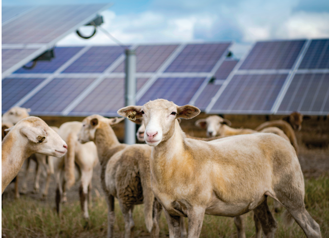
Un rebaño de ovejas pastan en terrenos del Centro de Energía Solar Blue Cypress de FPL para mantener el césped corto.

Sea uno de los primeros en recibir actualizaciones sobre este programa. Visite: » FPL.com/solartgether